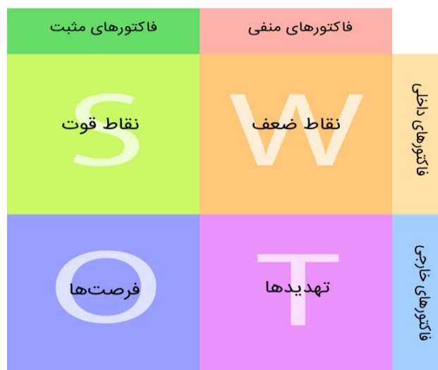
شکل ۱. ماتریس مفهومی تحلیل SWOT